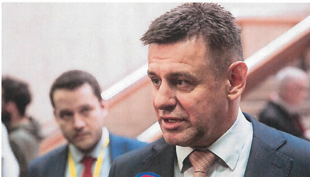
Minister životného prostredia László Sólymos